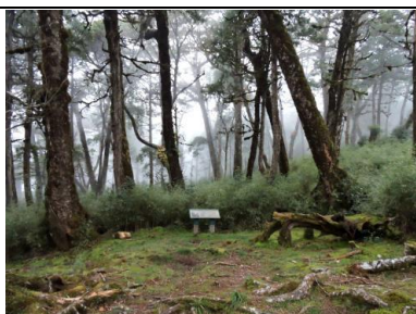
世界最美的10大之一見晴古道