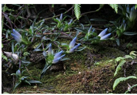
山壁上、步道上整片的台灣龍膽