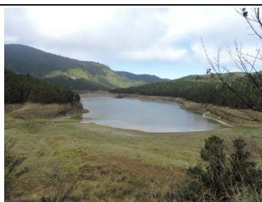
秒間變臉的鴛鴦湖